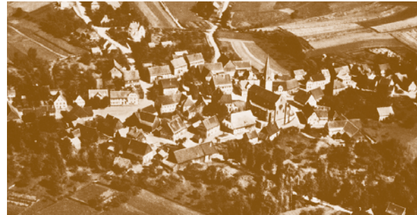
Bühlerzell ist 1938 noch von einem geschlossenen Streuobstwiesengürtel umgeben