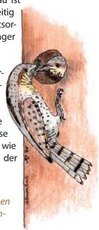
Kirchensaller Mostbirne kleinfrüchtige Mostbirne (Ernte: September) mit geringen Standortansprüchen; starkwachsender Baum mit hochpyramidaler, schöner Krone; wenig feuerbrandanfällig

Die Erhaltung von Obstwiesen dient auch dem Artenschutz, denn sie beherbergen aufgrund des weitgehenden Verzichts auf Pflanzenschutzmittel und Düngereinsatz besonders viele und auch seltene Tiere. Dazu zählen beispielsweise insektenfressende Fledermäuse und höhlenbrütende Vögel wie z.B. der Grünspecht oder der Wendehals.