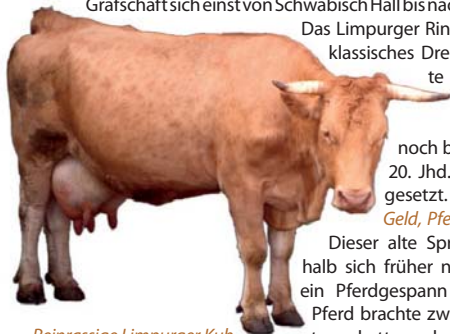
Reinrassige Limpurger Kuh

Die älteste noch existierende württembergische Rinderrasse ist das in der Gegend zwischen Aalen, Schwäbisch Gmünd und Gaildorf sowie im Hohenloher Raum beheimatete Limpurger Rind. Ihren Namen verdankt die Rasse dem Geschlecht der Limpurger, deren Grafschaft sich einst von Schwäbisch Hall bis nach Ellwangen erstreckte.