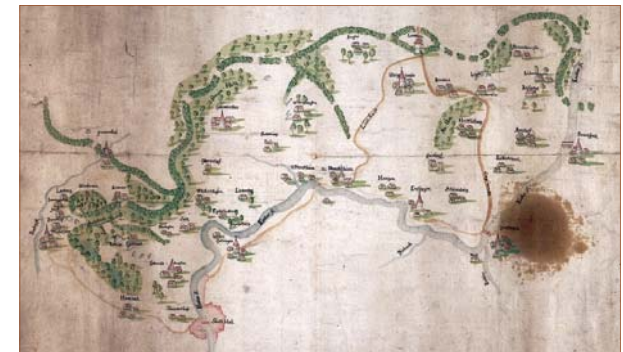
Plan eines Teils der Haller Landheg von etwa 1700

Die Haller Landheg erreichte eine Gesamtlänge von rund 230 km und wurde durch Grabenreiter ständig überwacht. An den Heerstraßen sicherte man die Durchlässe mit massiven und breiten Landtürmen, auf denen Dienstmannen mit Doppelhaken (schwere Handfeuerwaffen) ausgerüstet waren. Die Nebenstraßen waren durch Falltore und Schlagbäume versperrt, kleinere Schlupfe ermöglichten den Landwirten den Gang auf Wiesen und Felder.