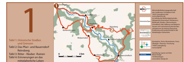
Tafel 1: Historische Straßen und Grenzen Tafel 2: Das Pfarr- und Bauerndorf Reinsberg Tafel 3: Ritter- Räuber- Ruinen Tafel 4: Erinnerungen an das mittelalterliche Leben