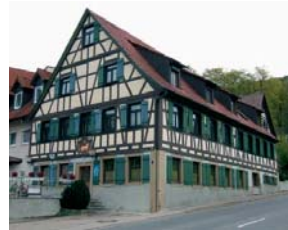
Cröffelbacher Steigengasthaus „Hotel Goldener Ochsen“ mit Türrelief