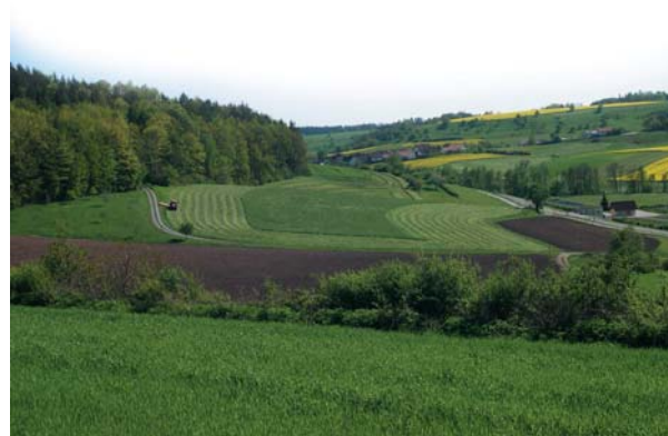
Talblick von Norden in Richtung Bühlerzell

Im flacheren Gipskeuperhangbereich ist Ackerbau und Wiesenwirtschaft möglich, wie im Bild ersichtlich. Die darüber folgende bewaldete Hangstufe im Schilfsandstein grenzt die Nutzungen klar ab. In der feuchten Talauie finden sich Wiesen und Weiden, die an den steileren Hängen in Streuobstwiesen übergehen. Auf den Hochflächen im Kiesel- und